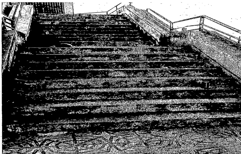
Fotografía 1.- Restos de envases alimenticios tirados por el suelo.