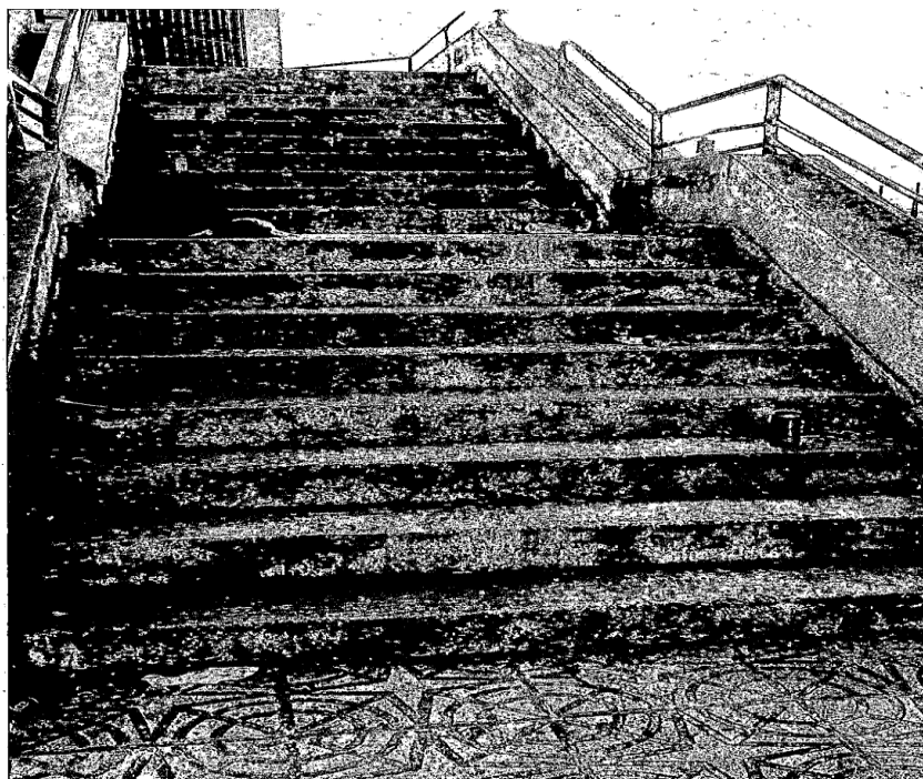
Fotografía 1.- Restos de envases alimenticios tirados por el suelo.