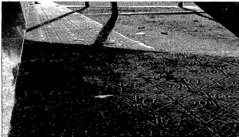
Fotografía 12.- Otra de restos de envases alimenticios tirados por el suelo.

SEGUNDO: Como consecuencia de ello se dio traslado de estos hechos a los Servicios Jurídicos municipales para la incoación del oportuno expediente sancionador.