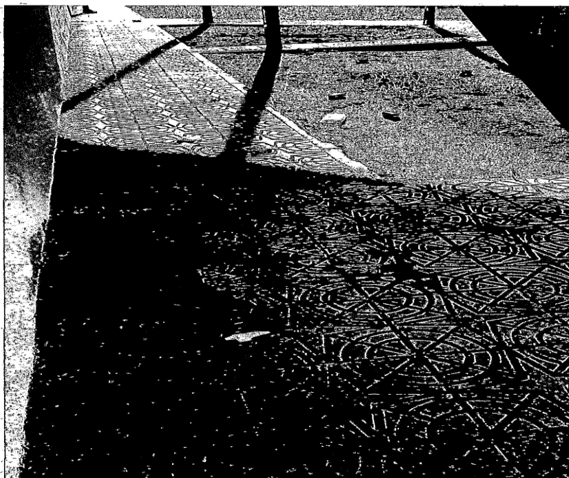
Fotografía 12.- Otra de restos de envases alimenticios tirados por el suelo.

SEGUNDO: Como consecuencia de ello se dio traslado de estos hechos a los Servicios Jurídicos municipales para la incoación del oportuno expediente sancionador. Dicho expediente se incoó el día 2 de julio de 2021. Tras intentar notificar en dos ocasiones, de forma infructuosa, por parte de esta Administración, el contenido del acuerdo de inicio del expediente sancionador nº 304San21,