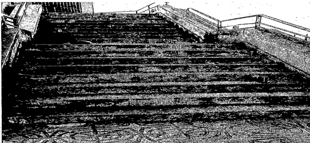
Fotografía 1.- Restos de envases alimenticios tirados por el suelo.