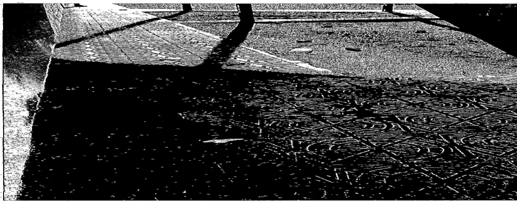
Fotografía 2.- Otra de restos de envases alimenticios tirados por el suelo.

SEGUNDO: Como consecuencia de ello se dio traslado de estos hechos a los Servicios Jurídicos municipales para la incoación del oportuno expediente sancionador.