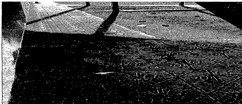
Fotografía 12.- Otra de restos de envases alimenticios tirados por el suelo.

SEGUNDO: Como consecuencia de ello se dio traslado de estos hechos a los Servicios Jurídicos municipales para la incoación del oportuno expediente sancionador.