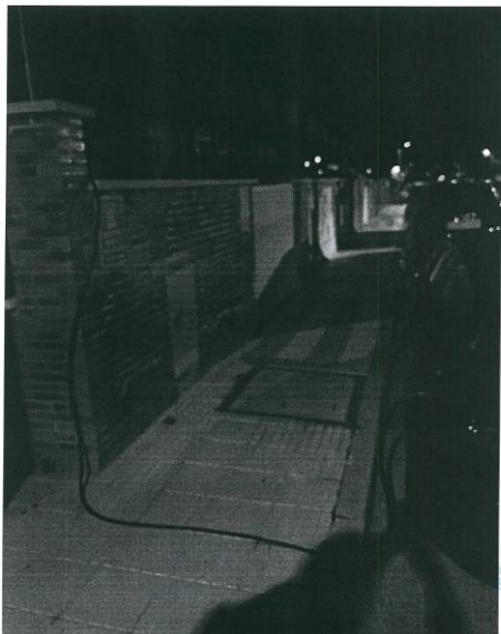
FOTOGRAFÍA Nº2: Fotografía de detalle donde se observa el cable de recarga invadiendo la acera peatonal.