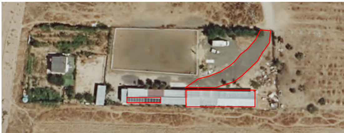
Ampliación de fotografía de la zona de la edificación.

Con el fin de dar traslado al departamento jurídico municipal, se notifica para su conocimiento y a los efectos oportunos.”